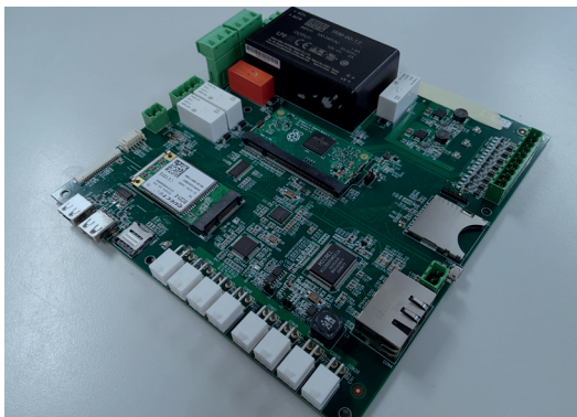
Maatwerk carrier met CM3 module waarbij alle functies en bedrading geïntegreerd zijn op één PCBA.