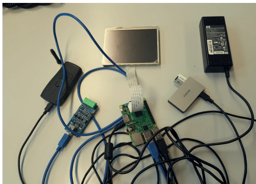
Voorbeeld van een POC met een Rpi en inkoop delen: voeding, GSM router, RPi en bedrading.

Venne Electronics ondersteunt u bij elk vraagstuk in elke fase.